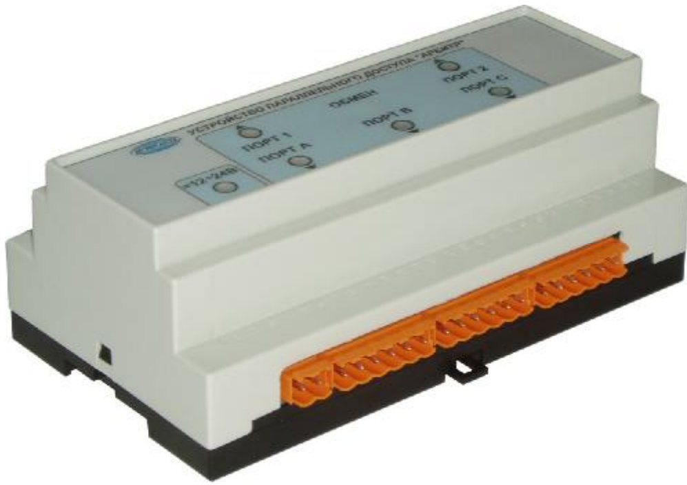
Рис. 3 Внешний вид Устройство параллельного доступа «АРБИТР»